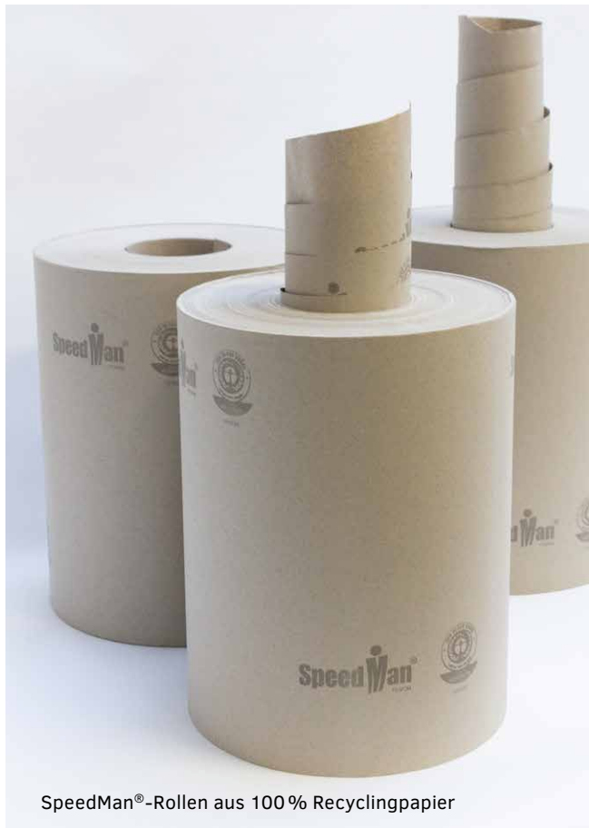
SpeedMan®-Rollen aus 100 % Recyclingpapier