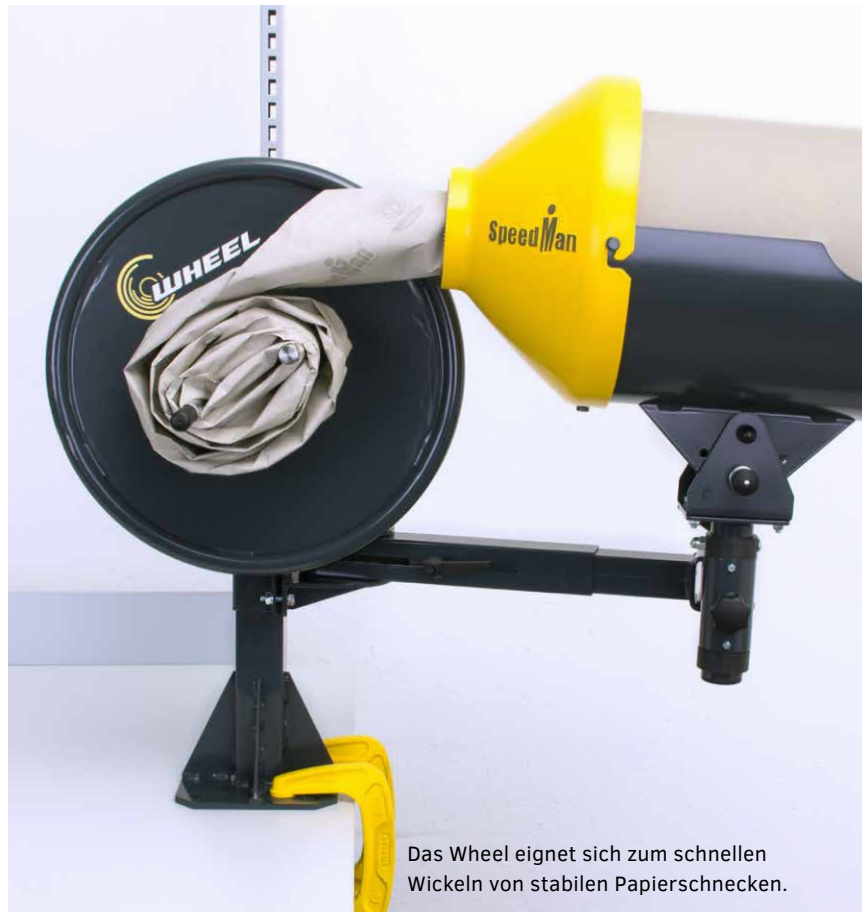
Das Wheel eignet sich zum schnellen Wickeln von stabilen Papierschnellen.